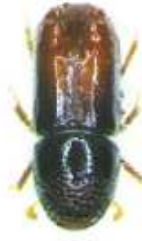
Dospělec lýkožrouta lesklého

se vyvíjí pod kůrou větví starých smrků, ve vrcholové části koruny nebo na mladých stromcích; na kmenech dospělých smrků ve střední a spodní části se vyskytuje méně často. Vývoj trvá 6 – 10 týdnů.