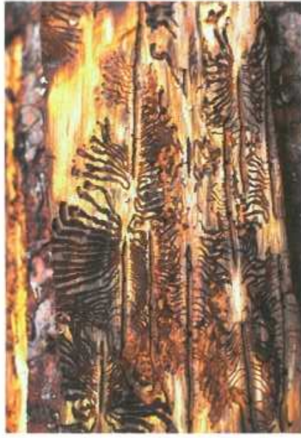
Rozvinutý požerok lýkožrouta smrkového

dospělých smrků s výjimkou jejich vrcholku (nejčastěji od stáří 60 let, výjimečně i mladších). Jeho vývoj trvá obvykle 6 – 10 týdnů, v závislosti na teplotě.