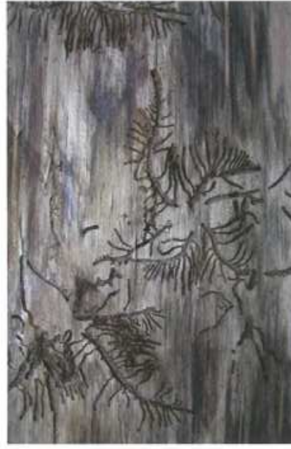
Požerok lýkožrouta lesklého