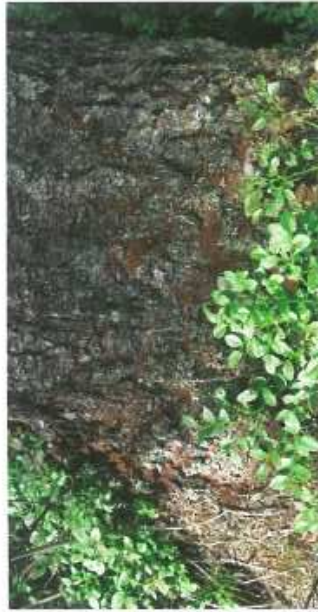
Drtinky na patě stojícího stromu

Na stojících stromech je prvním symptomem přítomnost drtinek na patě kmene. Na kmene se objevují závrtky, doprovázené často výrony pryskyřice (pozor: v případě oslabení suchem k tomuto smolení často nedochází). Posléze dochází k barevným změnám jehličí, které postupně rezne a opadává. Dochází také k opadávání kůry, napřed na malých ploškách, později prakticky na celém kmene. Napadené stromy již nelze zachránit, je nutné je urychleně pokácet a následně asanovat. Na ležících stromech se nacházejí závrtkové otvory, vedle kterých se objevují hromádky rezavých drtinek.