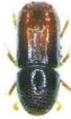
Dospělec lýkožrouta lesklého

se vyvíjí pod kůrou větví starých smrků, ve vrcholové části koruny nebo na mladých stromcích; na kmeni dospělých smrků ve střední a spodní části se vyskytuje méně často. Vývoj trvá 6 – 10 týdnů.