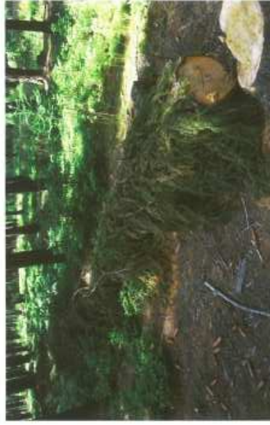
Lapák zakrytý větvemi

Lapák je pokácený a odvětvěný strom, podložený (aby brouci mohli využít celou plochu kmene) a zpravidla zakrytý větvemi (zpomalení vysychání kůry). Káci se před předpokládaným začátkem rojení, tj. zpravidla do konce března. Lapáky se musí kontrolovat, a to především z důvodu jejich obsazení, aby bylo možné včas přikácet další lapáky. Ty se přikacují, je-li lapák pině obsazen (cca 1 závrt na 1 dm 2 v nejhustěji napadené části kmene). Současně se kontroluje vývoj lýkožroutů, aby bylo možné lapáky včas asanovat.