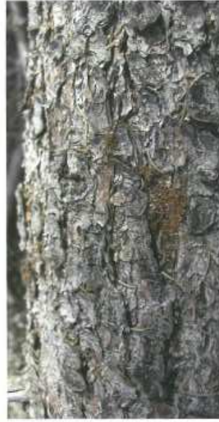
Drtinky na ležícím kmene