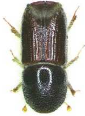
Dospělec lýkožrouta smrkového

Lýkožrout smrkový (cca 5 mm) napadá především čerstvě odumřelé dříví (polomy, vyřezané dříví v porostu nebo na skládkách), dále pak oslabené stojící stromy (např. suchem) a při přemnožení i zdravé stojící stromy. Vývoj probíhá pod kůrou na kmenech